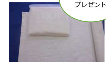
今生成りフェイスタオル

定員60名様になり次第、締め切りになります。「やまもく」までお気軽にお申込下さい！